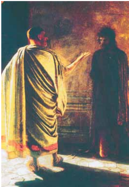
«Что есть истина?». Христос и Пилат. Николай Ге. (1890 г.)

колесниц и от столбов, около которых несли вахту римские воины. Именно тогда Понтий Пилат сказал: «Я никак вины не нахожу в Нем».