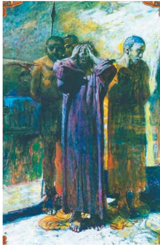
Голгофа. Николай Ге. (1893 г.)

Среди христианского квартала в северо-западной части Иерусалима возвышается храм Гроба Господня. Место это во время земной жизни Иисуса Христа находилось вне городских стен, к западу от Судных ворот, и называлось Голгофой (Краниевым, или Лобным, местом), а также Кальварией и Юдолью смерти. Оно служило местом казни преступников, которых приводили сюда на распятие, считавшееся тогда самой позорной смертью. Место это представляло собой скалистую неровную поверхность, и на одной из скал (собственно Голгофе) и был распят Спаситель наш Иисус Христос.