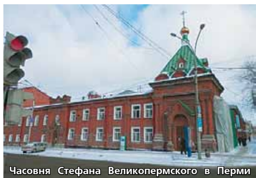
Часовня Стефана Великопермского в Перми

Приготовив себя к миссионерской деятельности, святитель Стефан в 1379 г. отправился в пермскую землю проповедовать христианство среди местных жителей. Из Устюга Стефан спустился по Северной Двине до впадения в нее Вычегды, откуда начинались поселения зырян. Точное место первого крещения зырян Стефаном Пермским неизвестно, но происходило это где-то на территории нынешнего Котласского района. Около восемнадцати лет длилось пребывание Стефана на зырянской земле. Начав проповедь с селения Пырас, Стефан прошел по берегам рек Вычегды, Выми и Сысолы до тысячи километров. На всем протяжении своего пути святитель устанавливал храмы, часовни, кресты, открывал школы, основал четыре монастыря. Новокрещенных обученных зырян он посвящал в священники. Святитель создал азбуку для языка коми, перевел на него богослужебные книги, вся служба велась в храмах на пермском языке. Ему удалось обратить в Православие большинство населения Пермского края. С 1383 г. Стефан – епископ пермской земли. Умер он в Москве 26 апреля 1396 г. Причислен к лику святых.