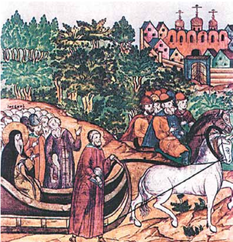
С обозом в Москву