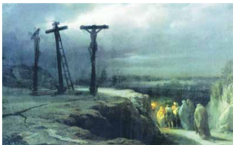
Ночь на Голгофе. Василий Верещагин. (1869 г.)

Две мраморные довольно крутые лестницы по 18 ступеней ведут на вершину Голгофы, которая справа от Камня миропомзания отсечена отвесно и имеет высоту более 10 метров. Здесь устроена небольшая часовня, скала Голгофа доходит почти до потолка храма. Единственно, что напоминает нам о свершившемся здесь событии, – это находящийся в греческом православном притворе престол (Десятая станция) и стоящее за ним большое (во весь рост) Распятие (Одиннадцатая станция) с изображениями Пресвятой Богородицы и любимого ученика Христова – Иоанна, стоящих у Креста. В этом месте, согласно Священному Писанию, Спаситель мира был оголен и пригвожден к Кресту. Два черных круга на полу отмечают места крестов двух разбойников, распятых вместе со Спасителем. Справа находился крест того разбойника, который просил Иисуса Христа не забыть его в Царствии Небесном (теперь здесь православный придел); слева – крест другого разбойника, который не покался и на кресте насмеялся над Спасителем (здесь католический придел Пригвождения ко Кресту). Позади престола и Распятия – иконостас с изображением Страстей Христовых, а в правой стороне – отделенная аркой церковь, в которой патриархи и архиереи в память о терновом венце Спасителя служат Божественную литургию без митр.