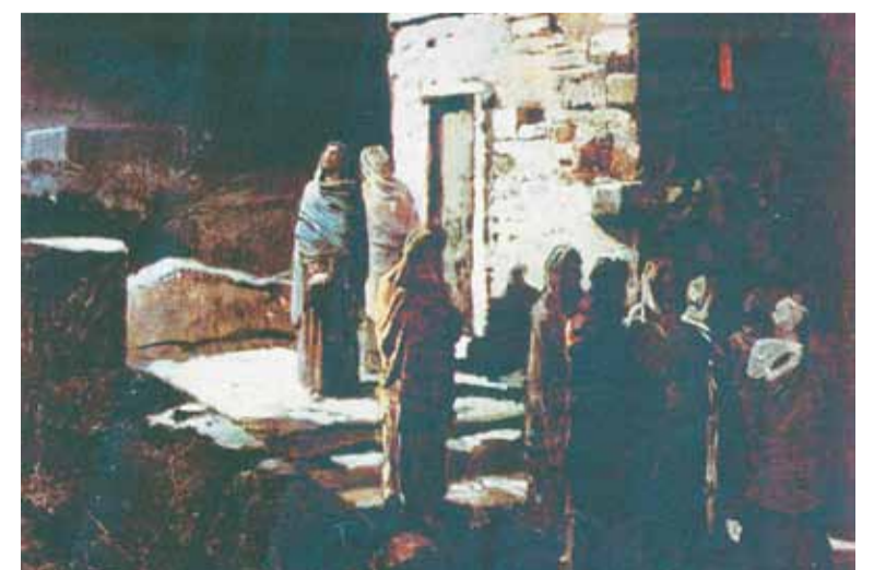
Выход Христа с учениками с Тайной вечери в Гефсиманский сад. Николай Ге (1888 г.)

Шагах в двенадцати от дома Понтия Пилата, на другой стороне улицы Виа Долороза, отмечена Первая станция скорбного пути – место, где римский прокуратор судил Спасителя мира. В IV в. святая равноапостольная царица Елена возвела здесь церковь, но теперь на этом месте стоит женский католический монастырь «Сестры Сиона». В нем бережно хранятся помост и те самые камни, на которых стоял Иисус Христос: это гранитные и известняковые плиты, потрескавшиеся и выщербленные временем, со следами колес от