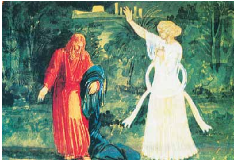
Христос в Гефсиманском саду. Александр Иванов (1850 г.)

Сохранилось восемь древних маслин – остаток вертограда (сада), современного страдания Иисуса Христа. Эти деревья с корявыми многовековыми стволами яв-